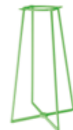
Spalvieri & Del Ciotto