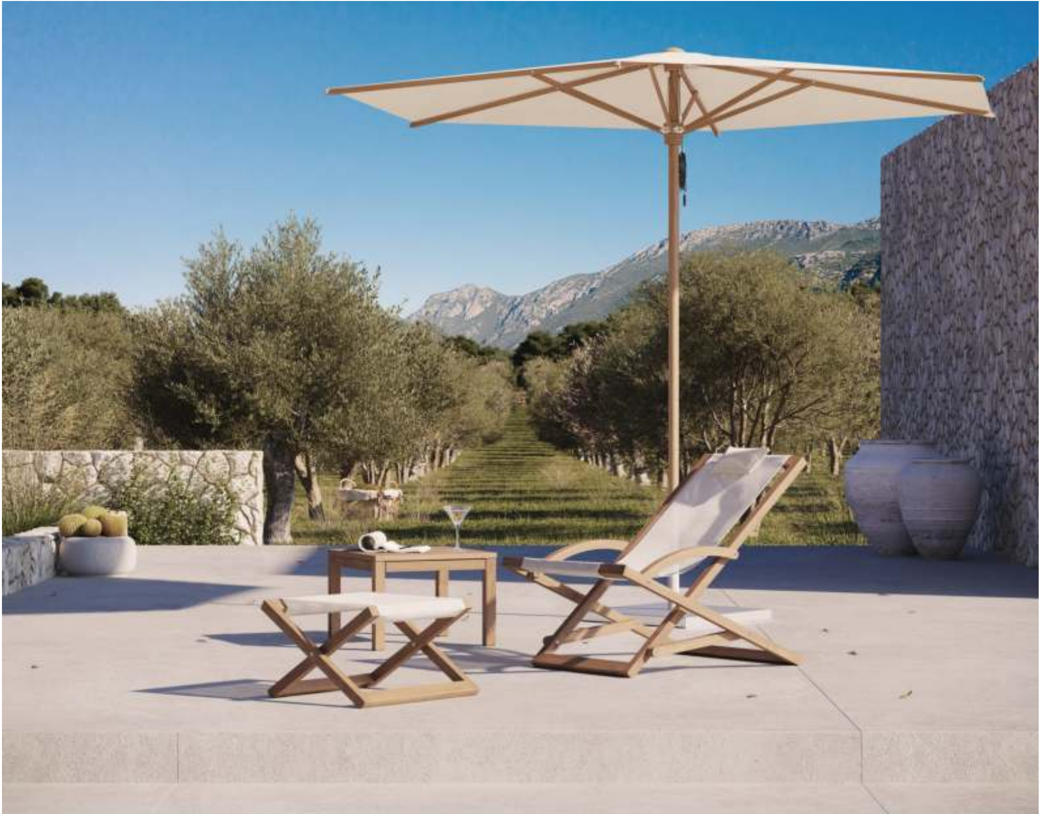
BEACHER FOLDABLE CHAIR (P. 251) - XQI 50 SIDE TABLE (P. 369) - SHADY SLIM PARASOL (P. 394)