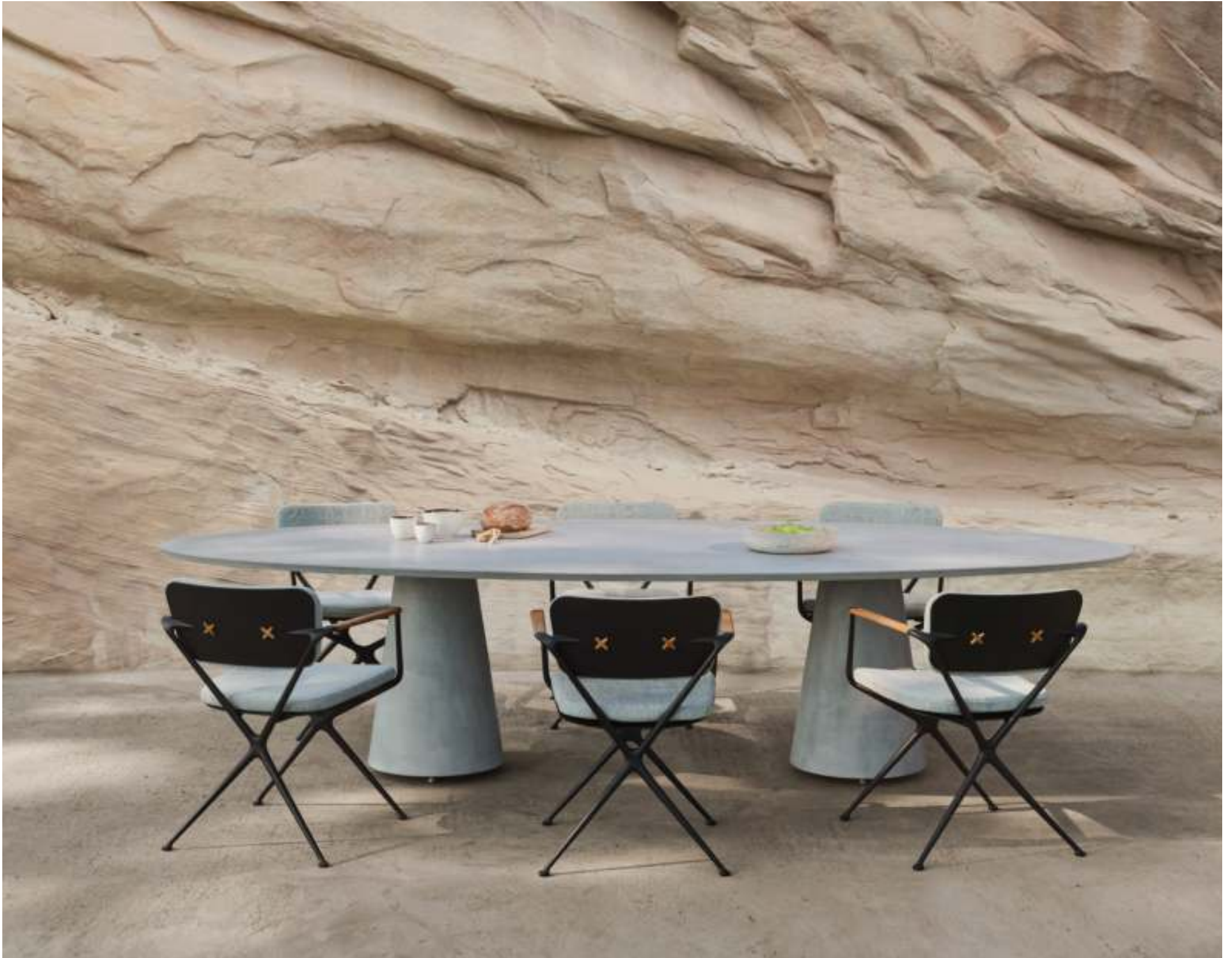
EXES 55 DINING CHAIRS (P. 249) - CONIX 3214 DINING TABLE (P. 246)