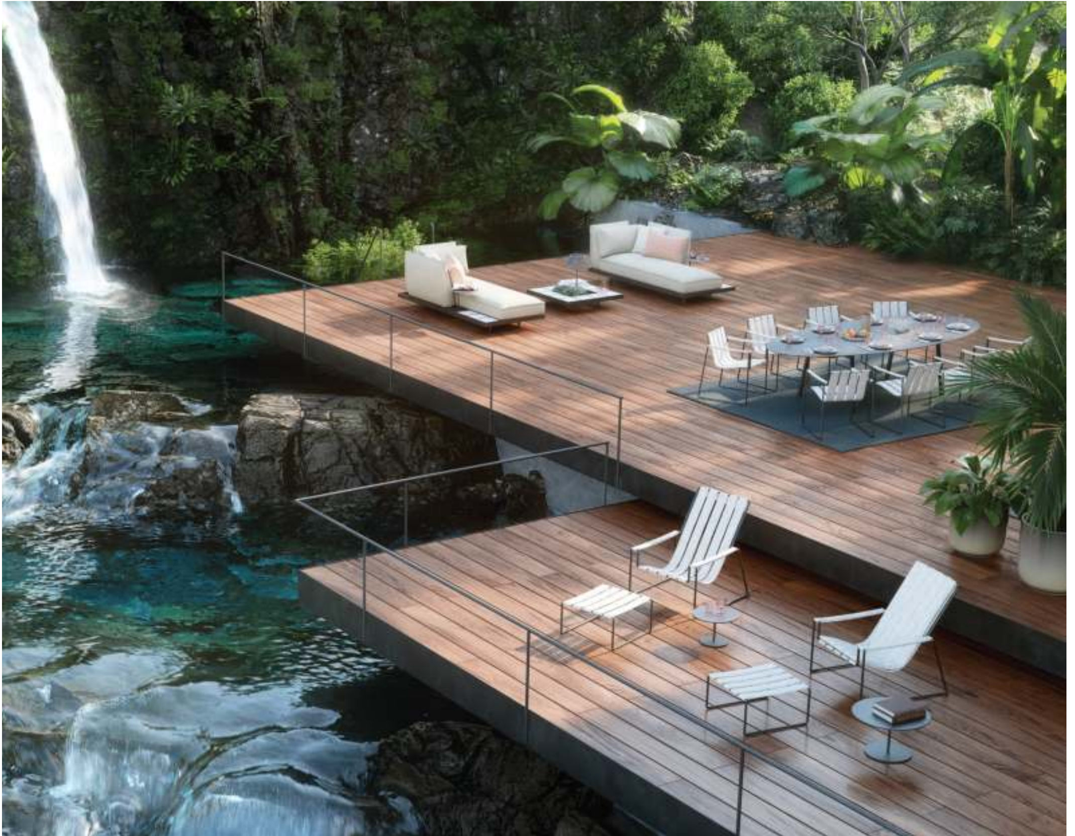
STRAPPY 195 LOUNGER (P. 316) - BUTLER 40 & 60 SIDE TABLES (P. 222) - STRAPPY 55 DINING CHAIR (P. 317) - STYLETTO 3214 DINING TABLE (P. 331) - RUG (P. 385) - MOZAIX LOUNGE (P. 267)