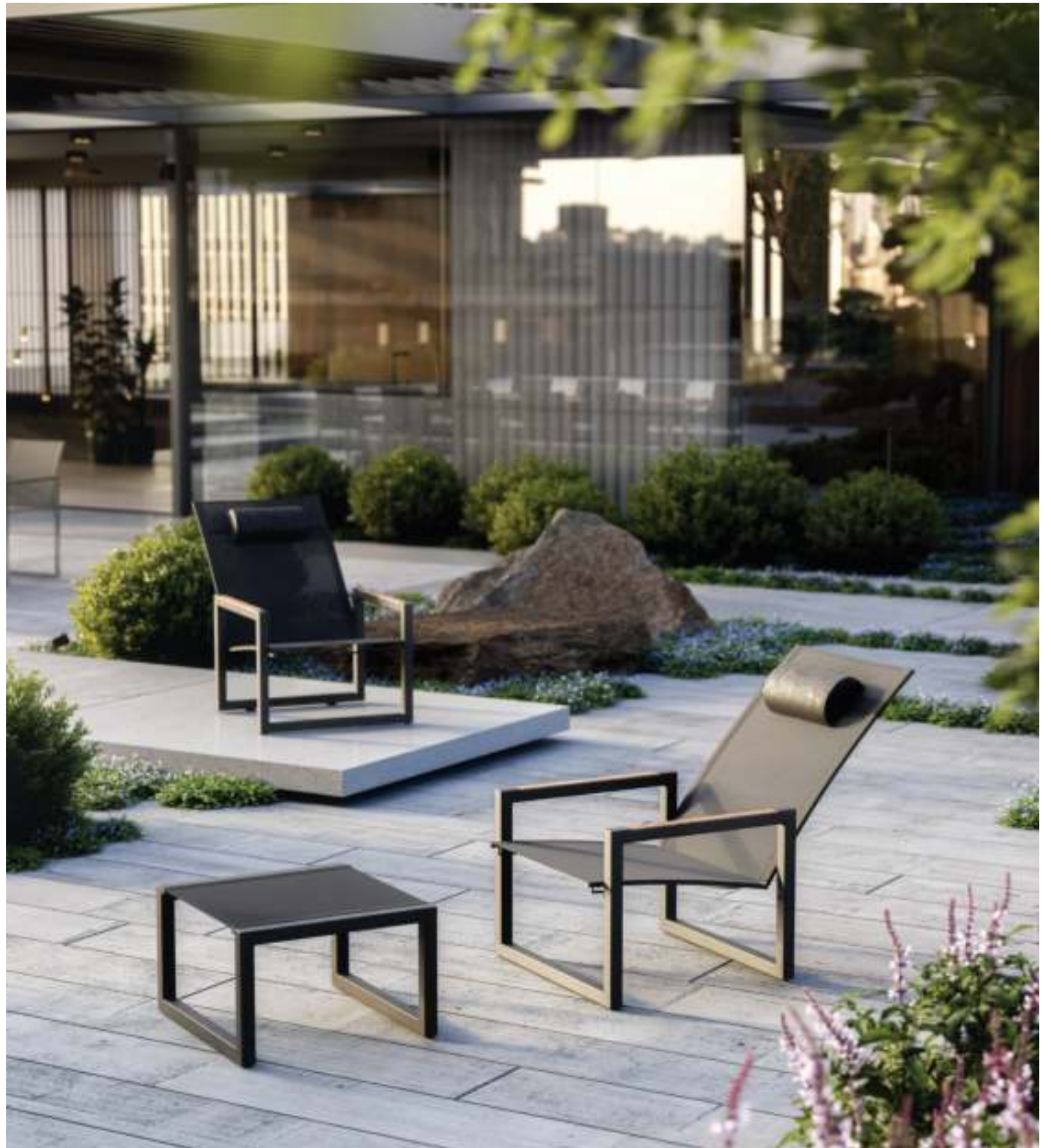
NINIX 60 RELAX CHAIR & FOOTREST (P. 282)