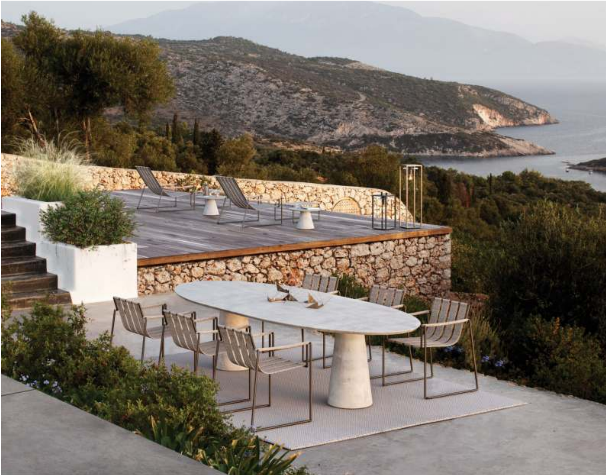
50 CONIX 2513 DINING TABLE (P. 246) - STRAPPY 55 DINING CHAIRS (P.317) - RUG (P. 385) - STRAPPY 195 LOUNGERS (P. 318) - CONIX 60 SIDE TABLE (P. 243) - DOME LIGHTS