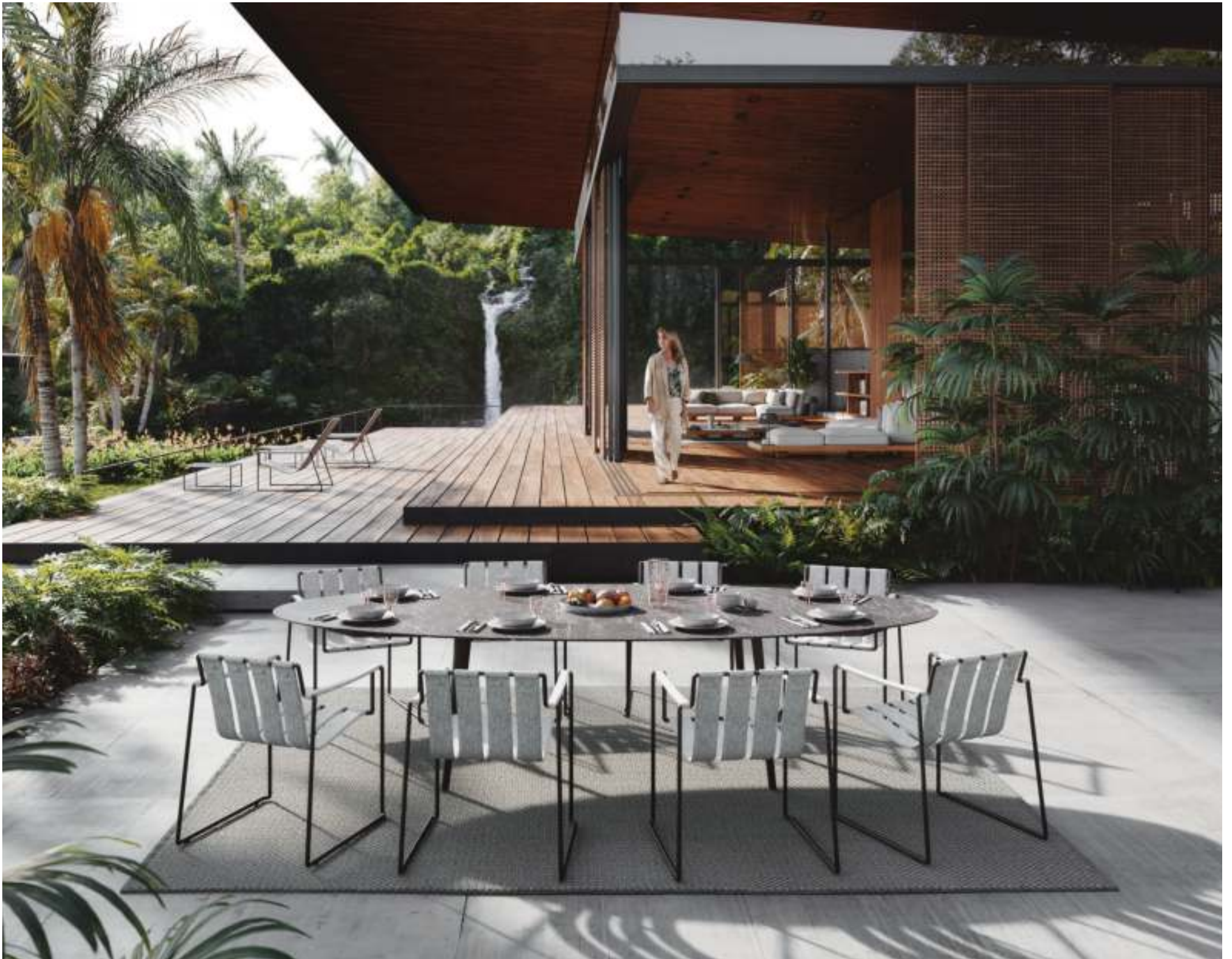
STRAPPY 55 DINING CHAIR (P. 317) - STYLETTO 3214 DINING TABLE (P. 331) - RUG (P. 385) - MOZAIX LOUNGE (P. 267) - STRAPPY 195 LOUNGER (P. 316)