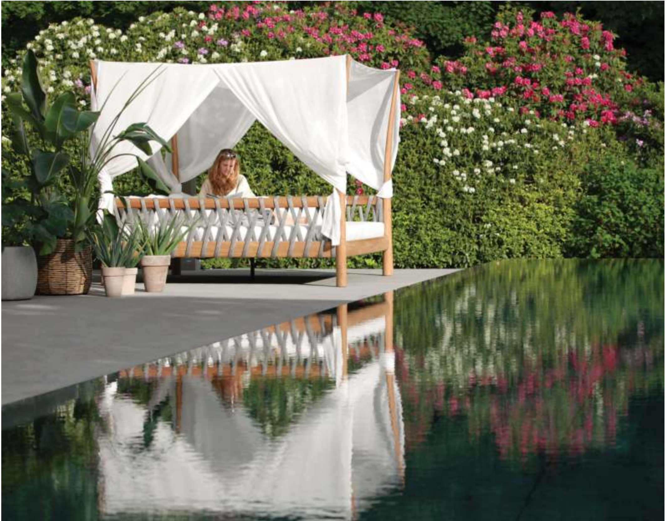
TUSKANY DAYBED (P. 361)