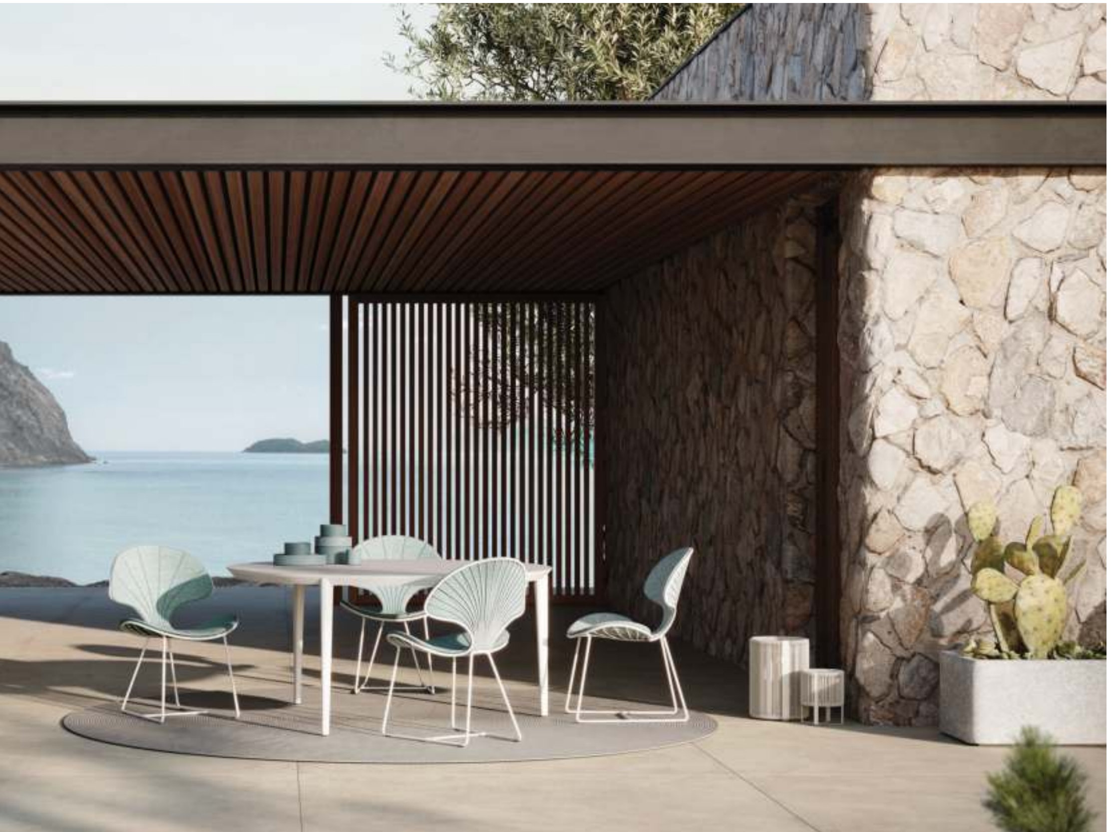
OSTREA 47 DINING CHAIRS (P. 299) - U-NIITE 160 DINING TABLE (P. 364) - RUG (P. 385)