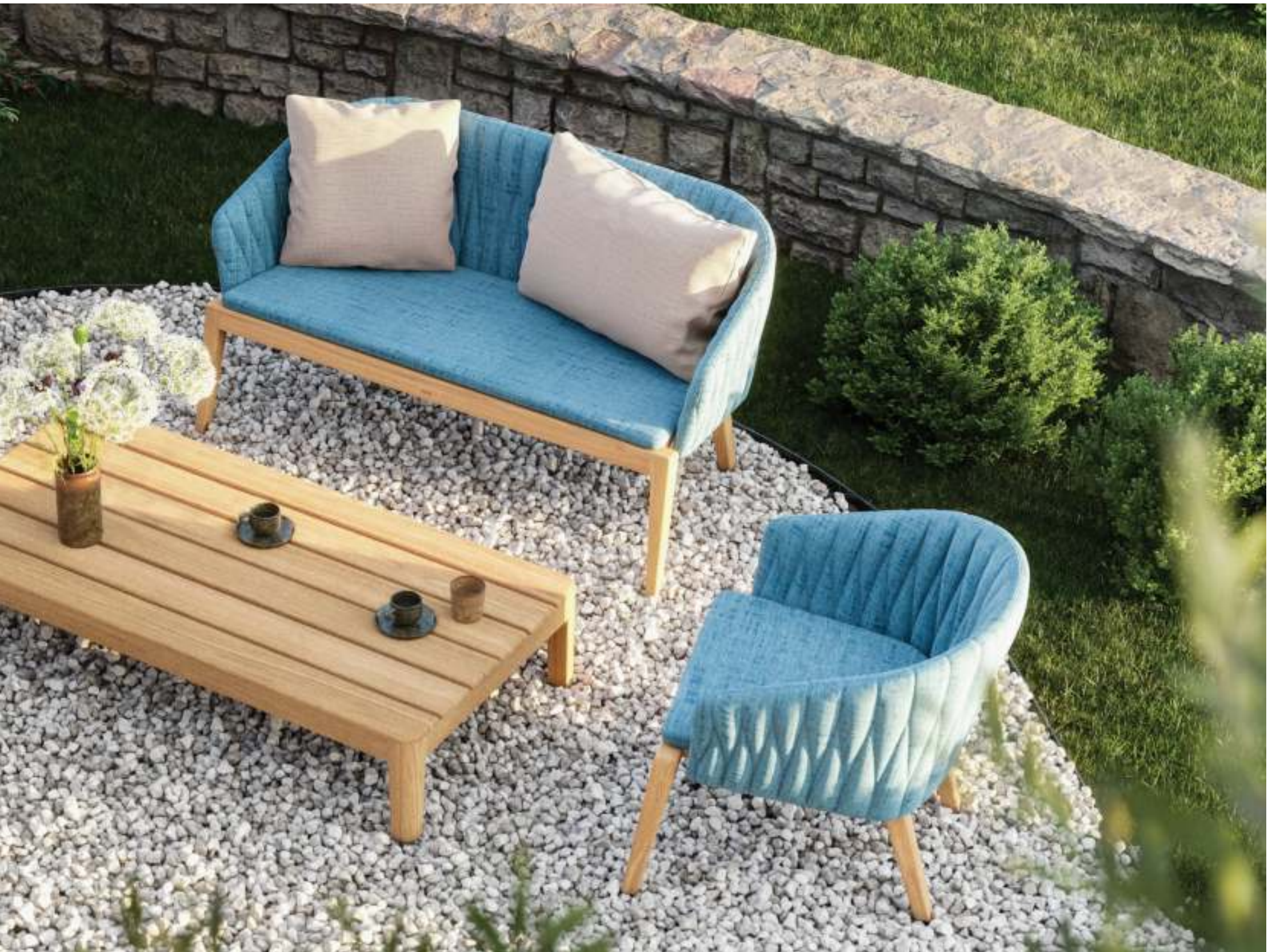
CALYPSO 77 LOW CHAIR (P. 227) - CALYPSO 135 BENCH (P. 230) - CALYPSO 140 LOUNGE TABLE (P. 232) - TRISTAR LIGHTS