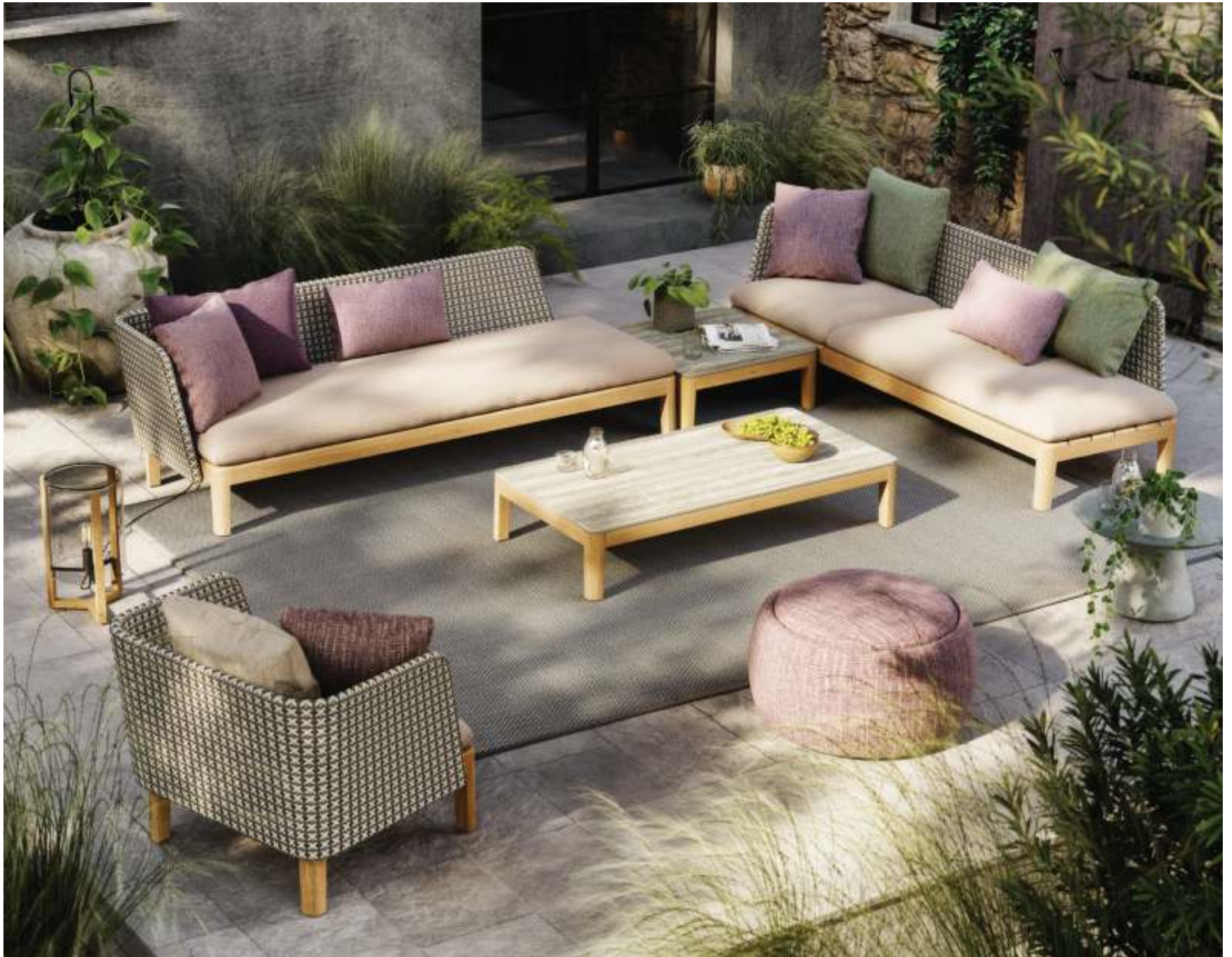
CALYPSO LOUNGE (P. 229) - TONO 70 POUF (P. 357) - RUG (P. 385) - TRISTAR LIGHT