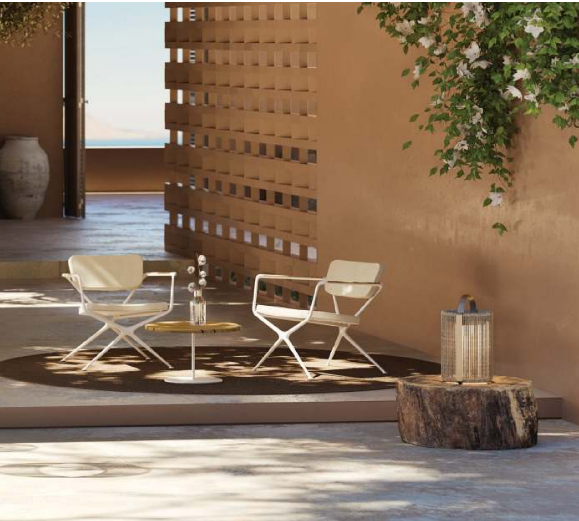
EXES 77 LOW CHAIR (P. 249) - BUTLER 40 SIDE TABLE (P. 221) - RUG (P. 385) - ROPY LIGHT