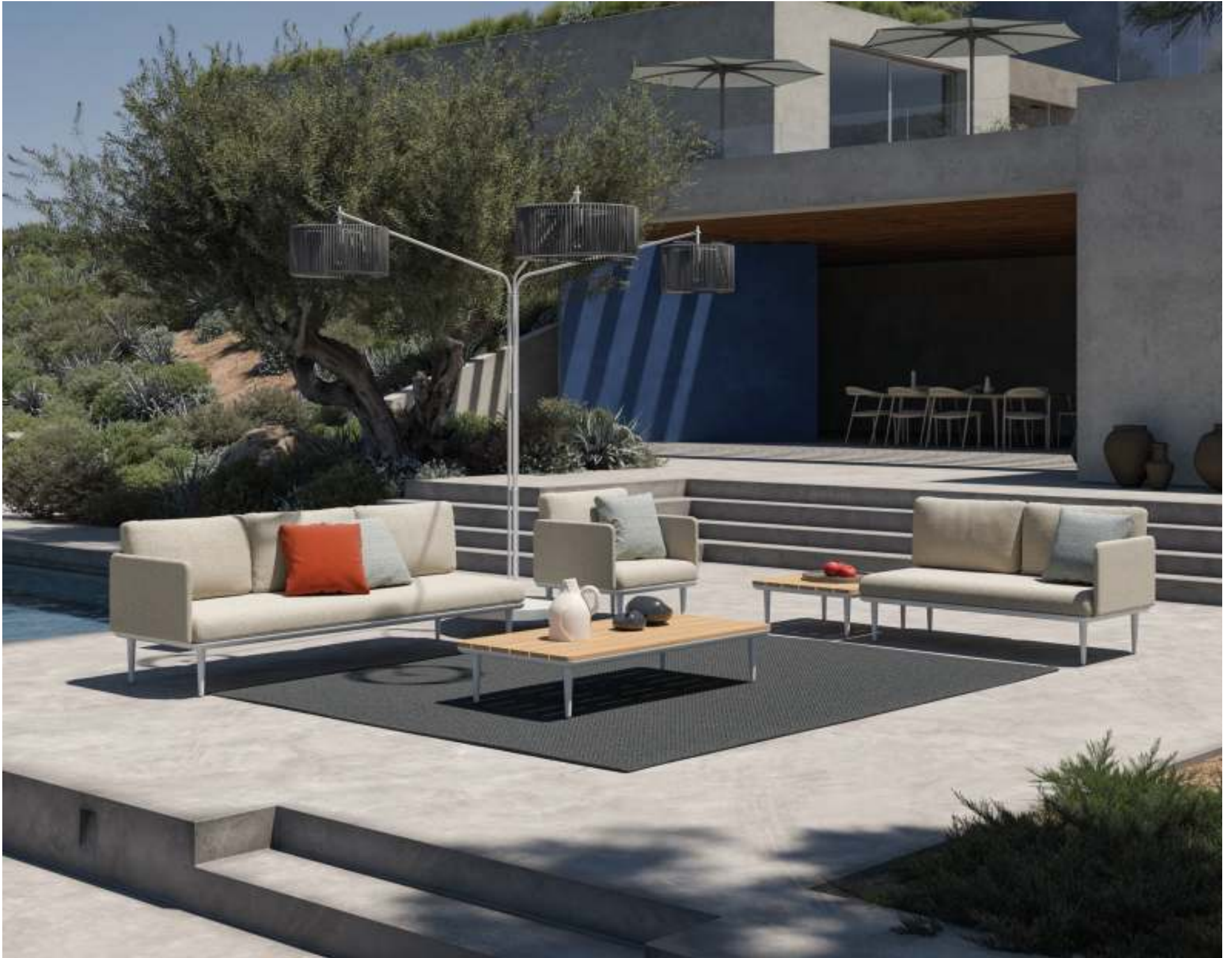
STYLETTO LOUNGE (P. 338) - RUG (P. 385) - TRILUX LIGHT