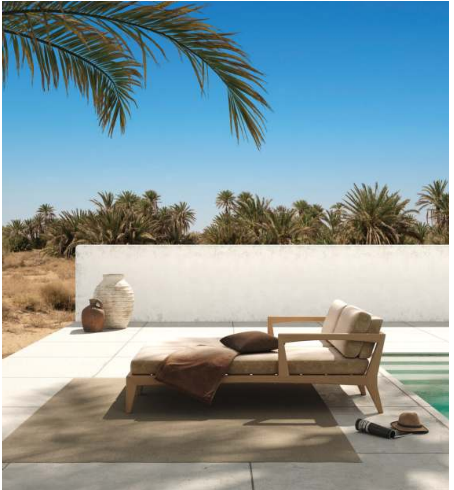
ZENHIT LOUNGE (P. 375) - RUG (P. 385)