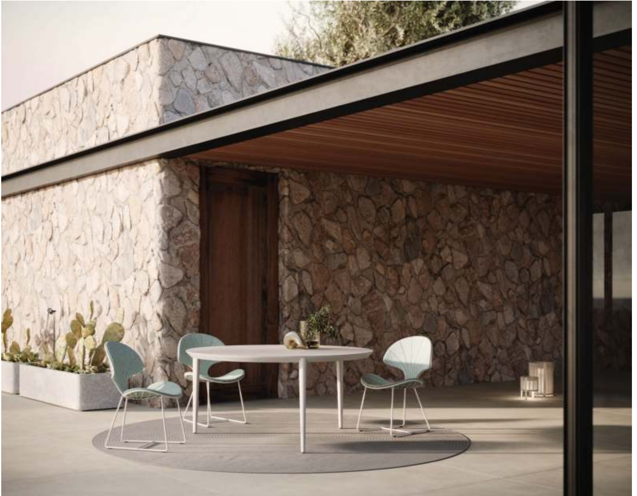
OSTREA 47 DINING CHAIR (P. 298) - U-NIITE 160 DINING TABLE (P. 364) - RUG (P. 385)