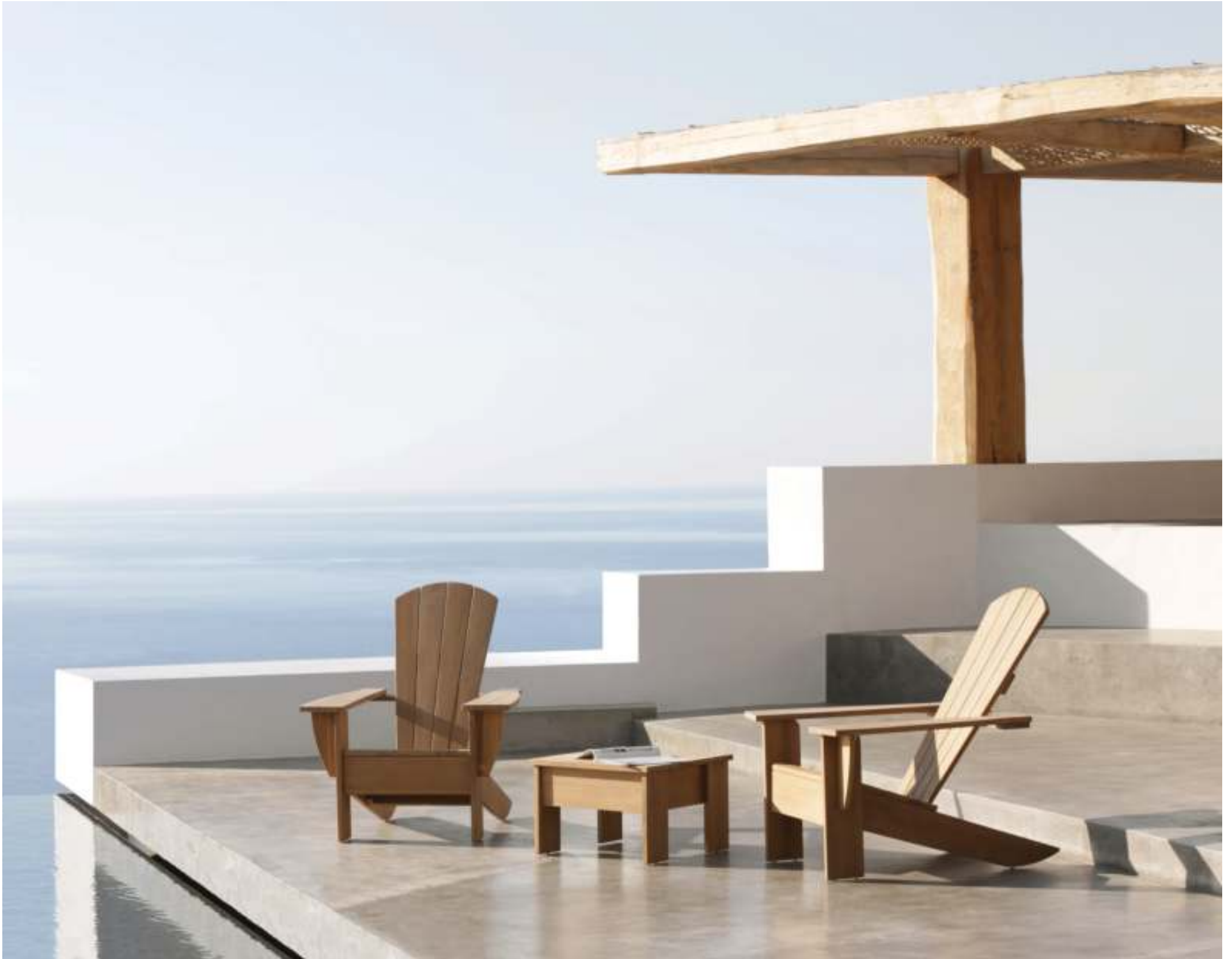
NEW ENGLAND LOUNGE CHAIRS & FOOTREST / SIDE TABLE (P. 279)