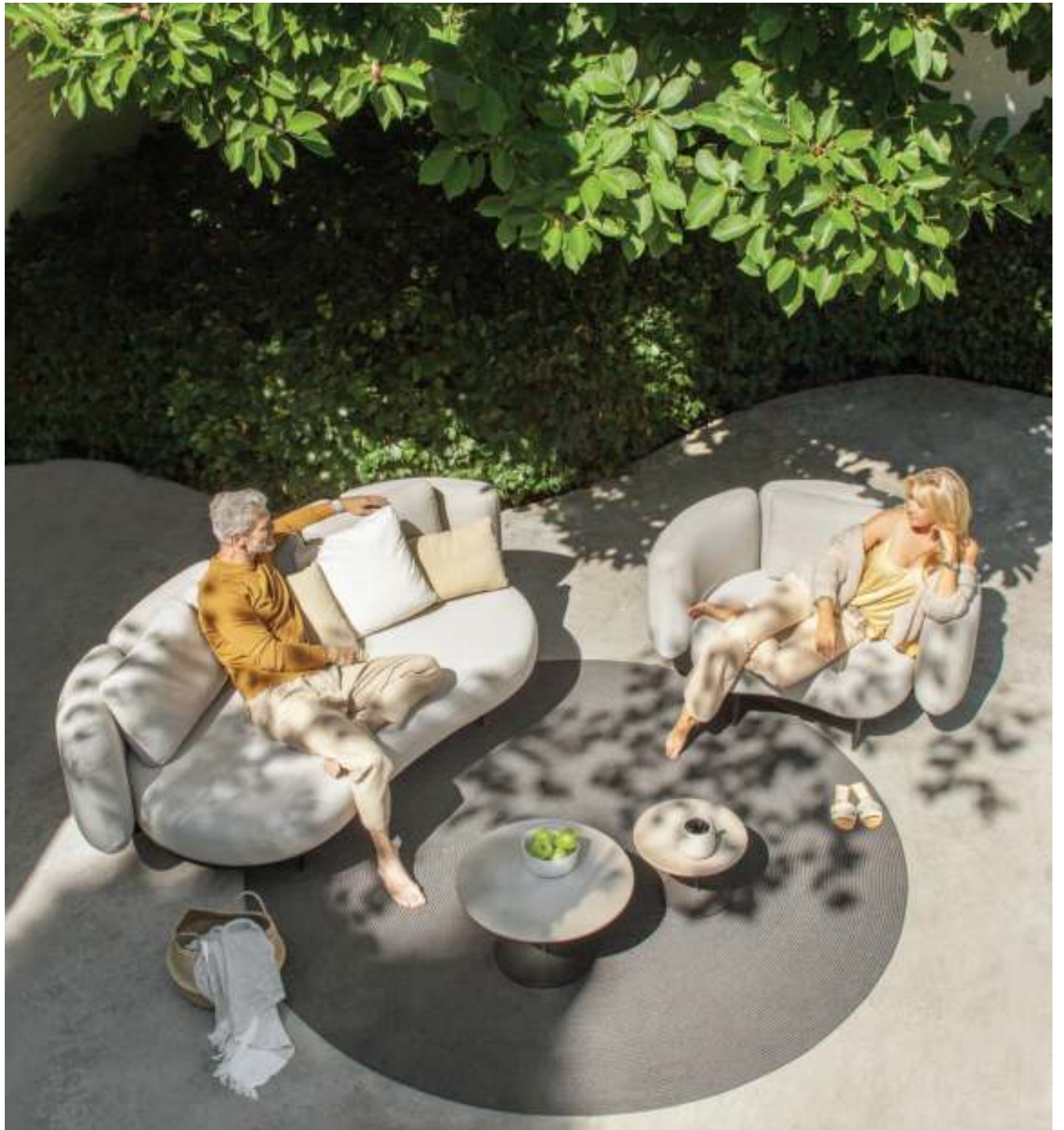
ORGANIX LOUNGE (P. 302) - BUTLER 40 & 60 SIDE TABLES (P.220) - RUG (P. 381)