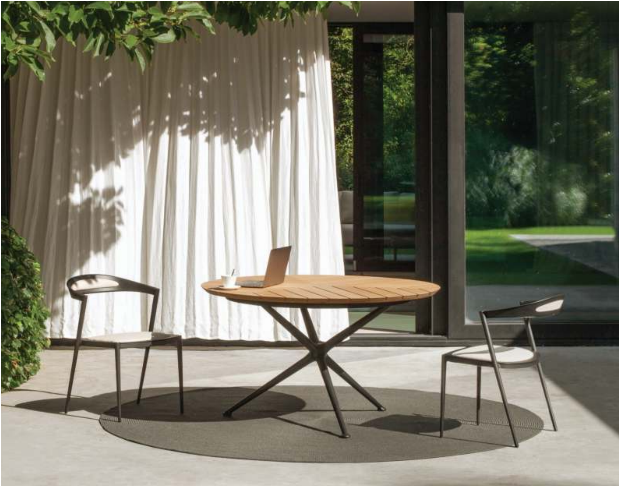
STYLETTO 55 DINING CHAIRS (P. 320) - EXES 120 DINING TABLE (P. 250) - RUG (P. 385)