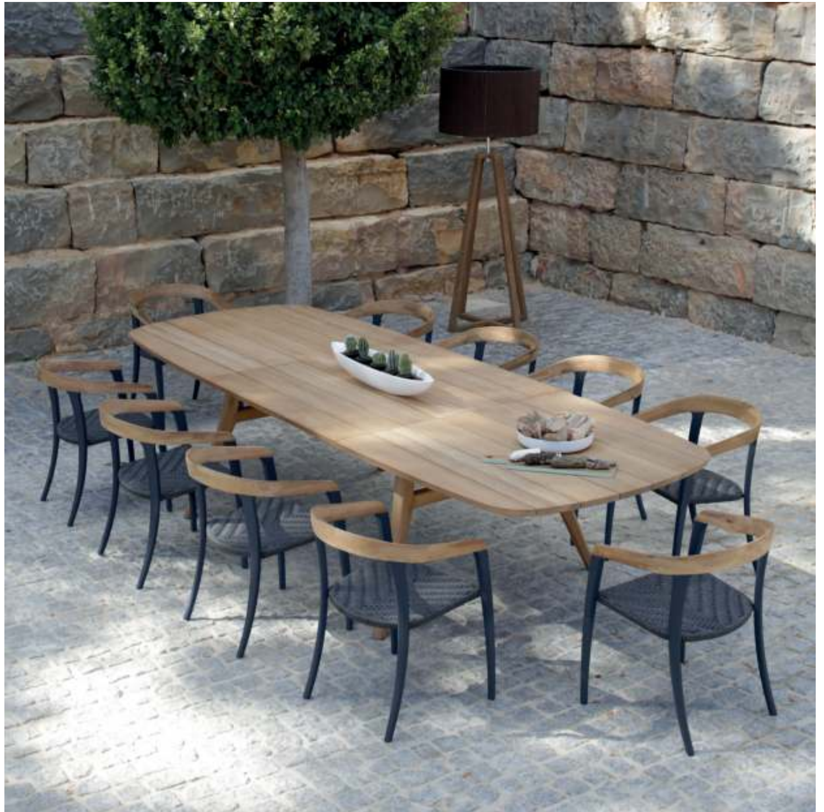
ZIDIZ 320 EXTENDABLE DINING TABLE (P. 383) - JIVE 55WG DINING CHAIR (P. 259) - CLUB LOUNGE LIGHT