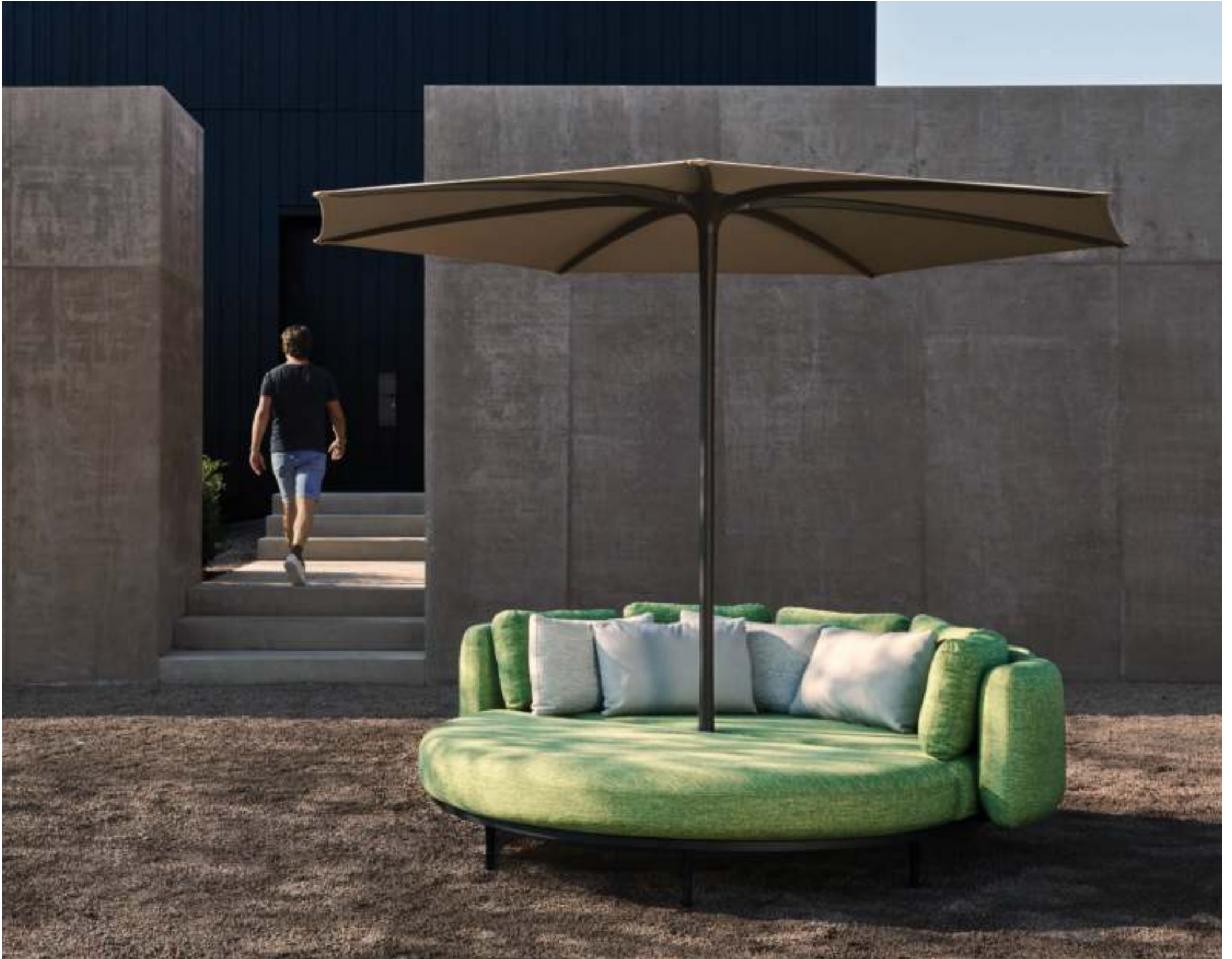
ORGANIX LOUNGE DAYBED (P. 310) - PALMA PARASOL (P. 385)