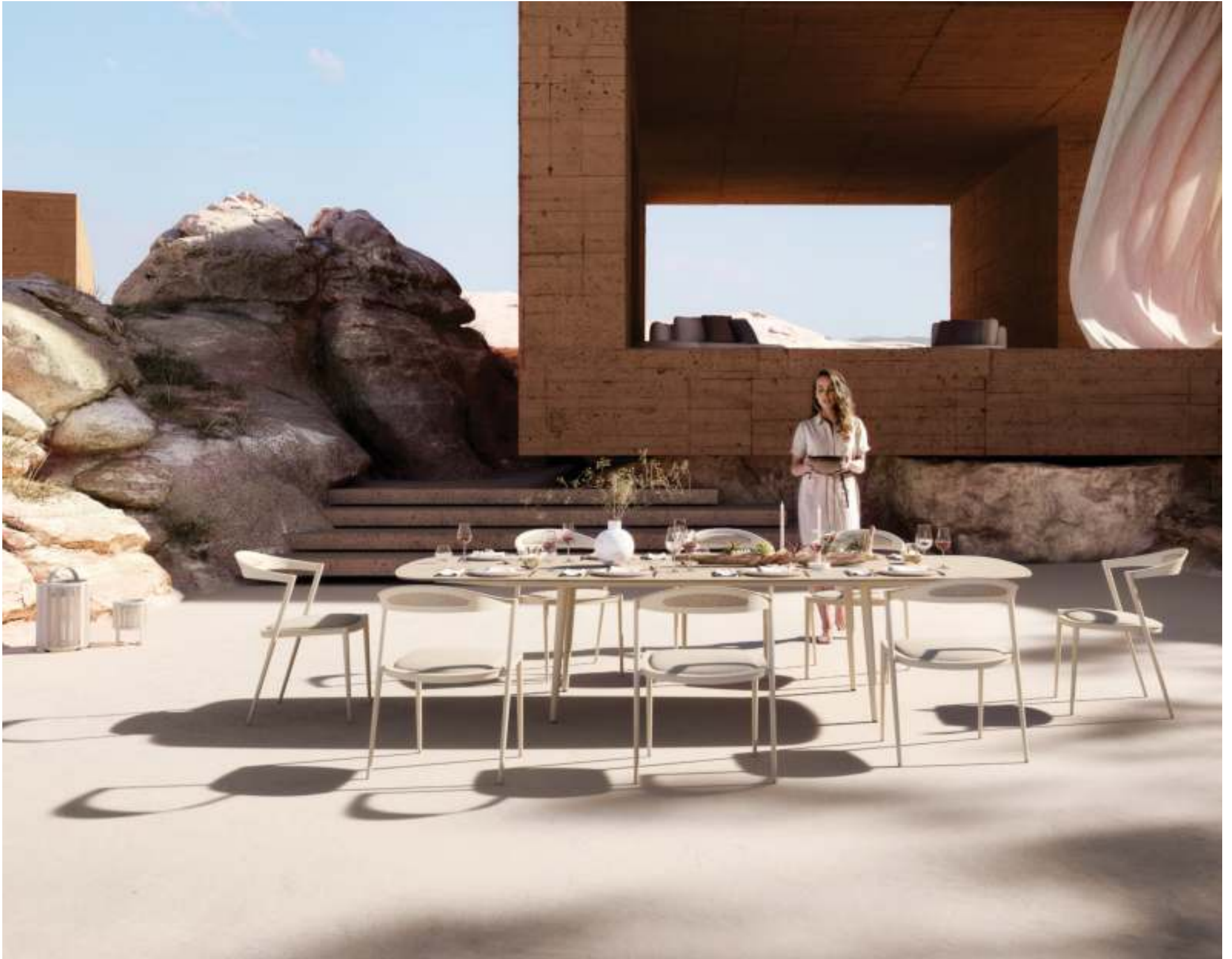
STYLETTO 300 DINING TABLE (P. 326) - STYLETTO 55 DINING CHAIRS (P. 320)