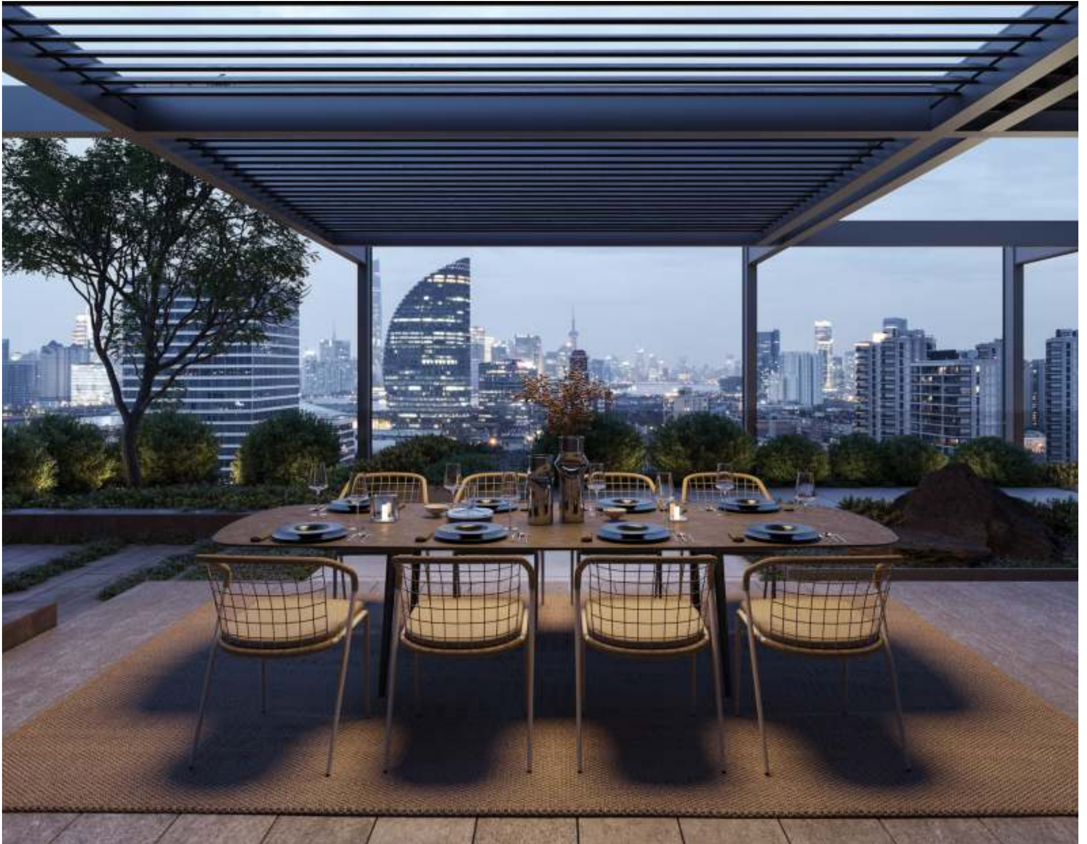
FENSI 55 DINING CHAIRS (P. 254) - STYLETTO 300 DINING TABLE (P. 326) - RUG (P. 385)