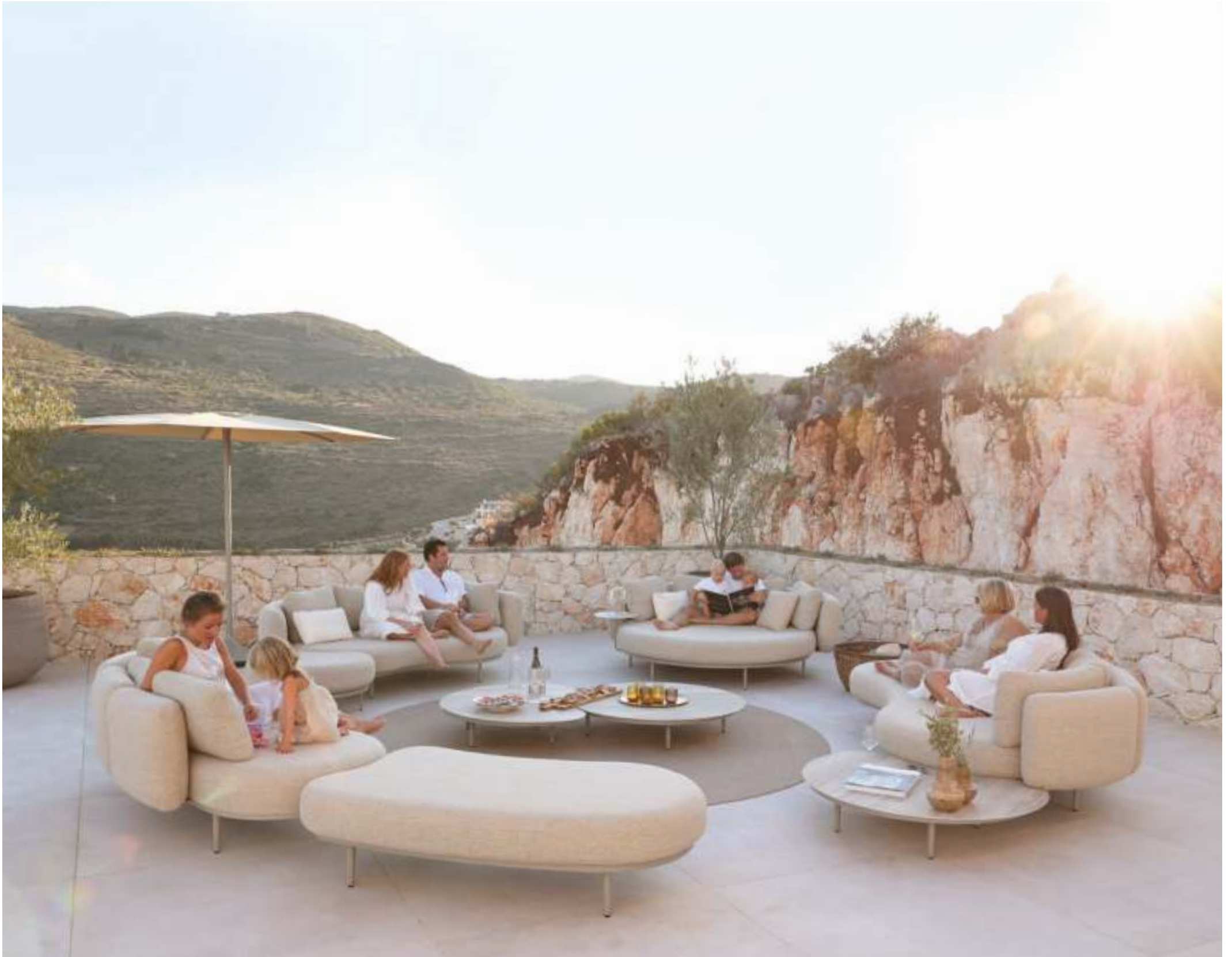
ORGANIX LOUNGE (P. 302) - RUG (P. 385) - PALMA PARASOL (P. 389)