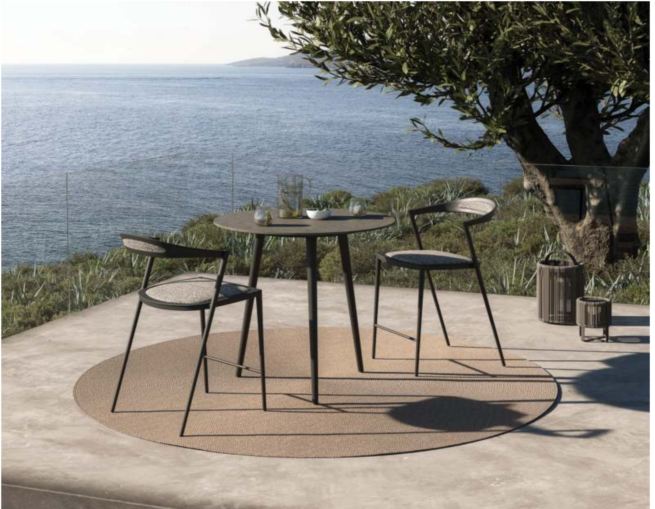
STYLETTO 43 BAR CHAIR (P. 320) - STYLETTO 90 COUNTER HEIGHT TABLE (P. 332) - RUG (P. 385) - ROPY LIGHTS