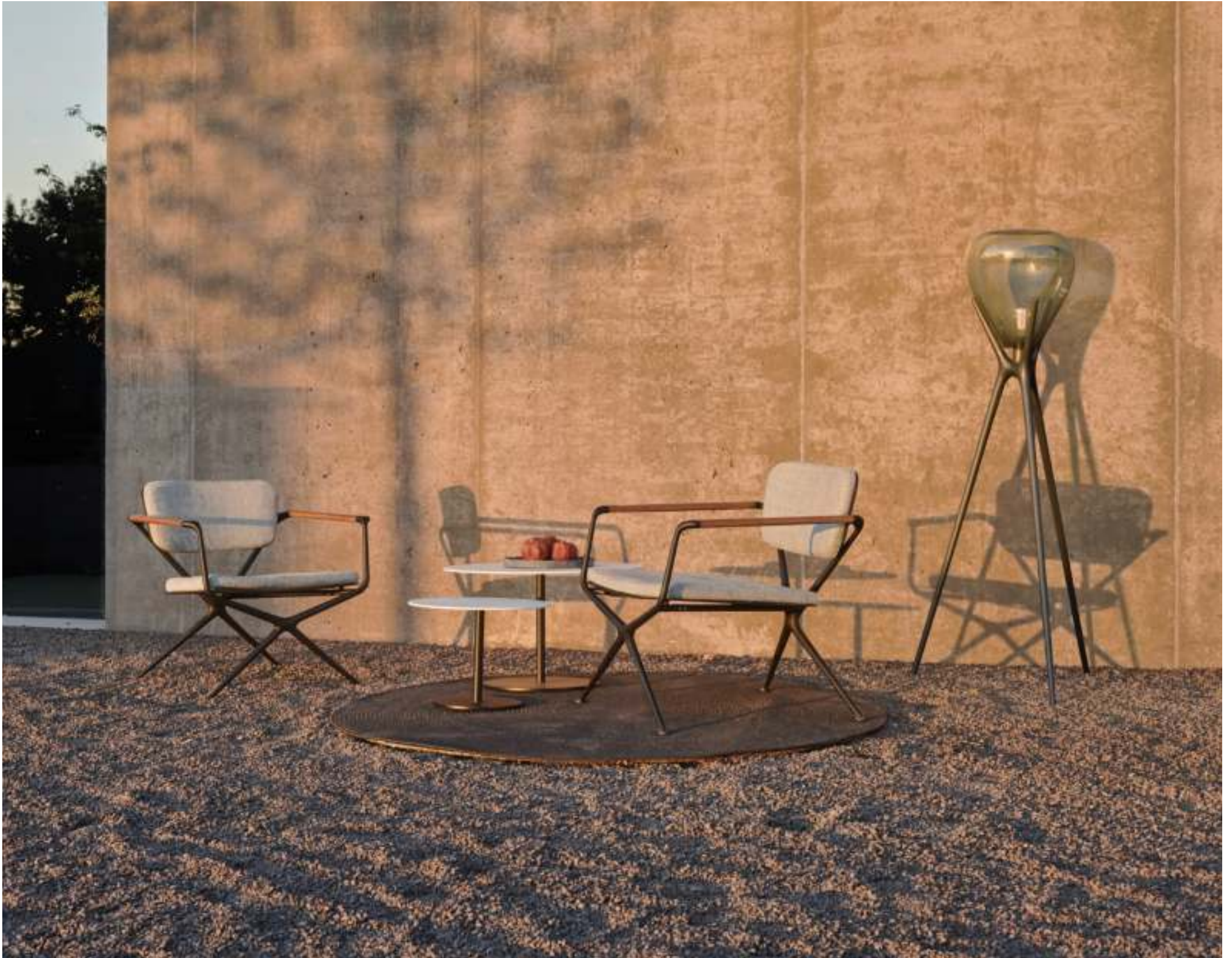
EXES 77 LOW CHAIRS (P. 249) - BUTLER 40 & 60 SIDE TABLES (P. 220) - RUG (P. 385) - STYLETTO LIGHT