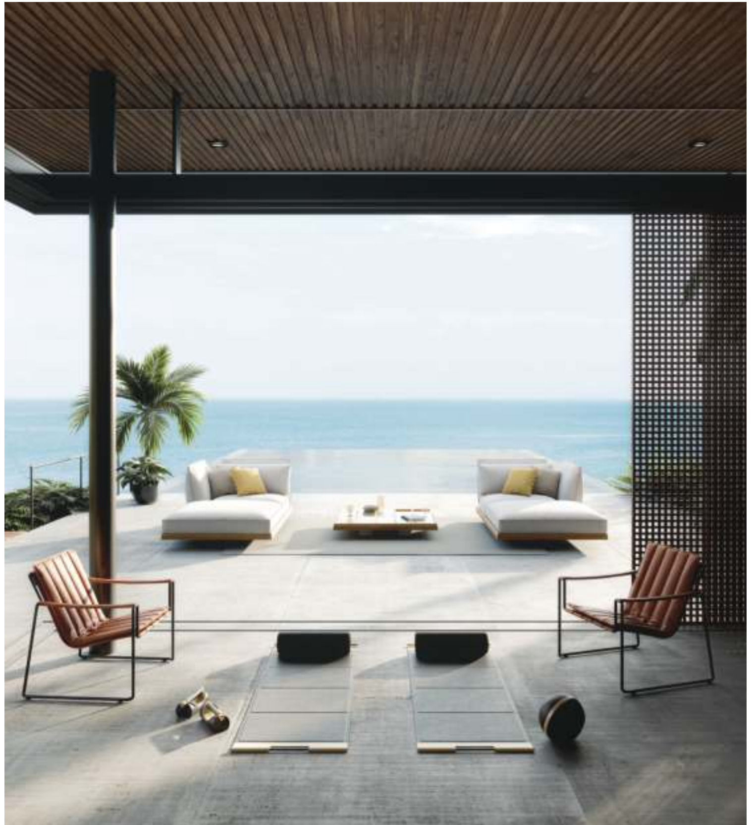
STRAPPY 77 LOW CHAIR (P. 316) - MOZAIK LOUNGE (P. 267)