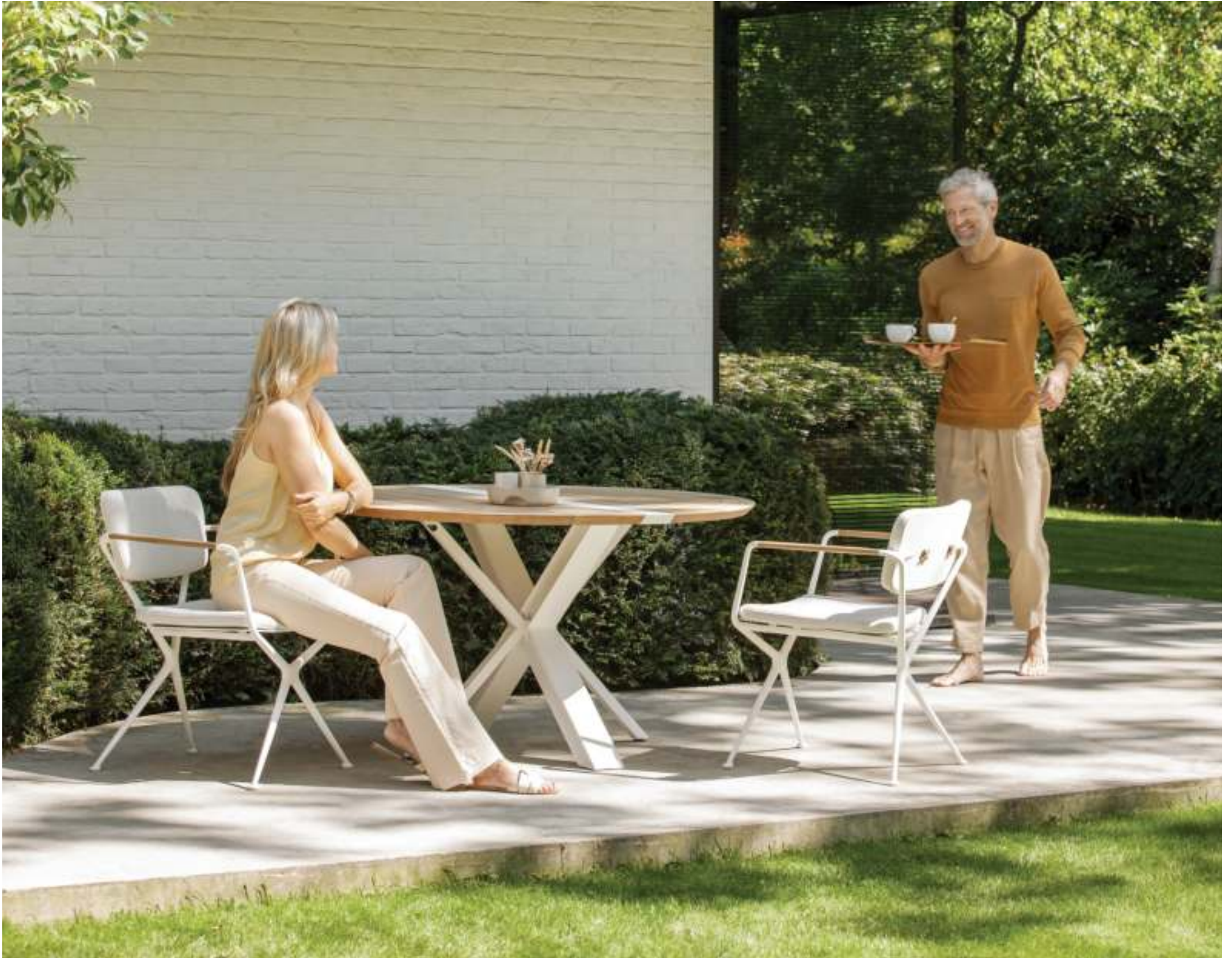
TRAVERSE 130 FOLDABLE DINING TABLE (P. 359) - EXES 55 DINING CHAIRS (P. 249)