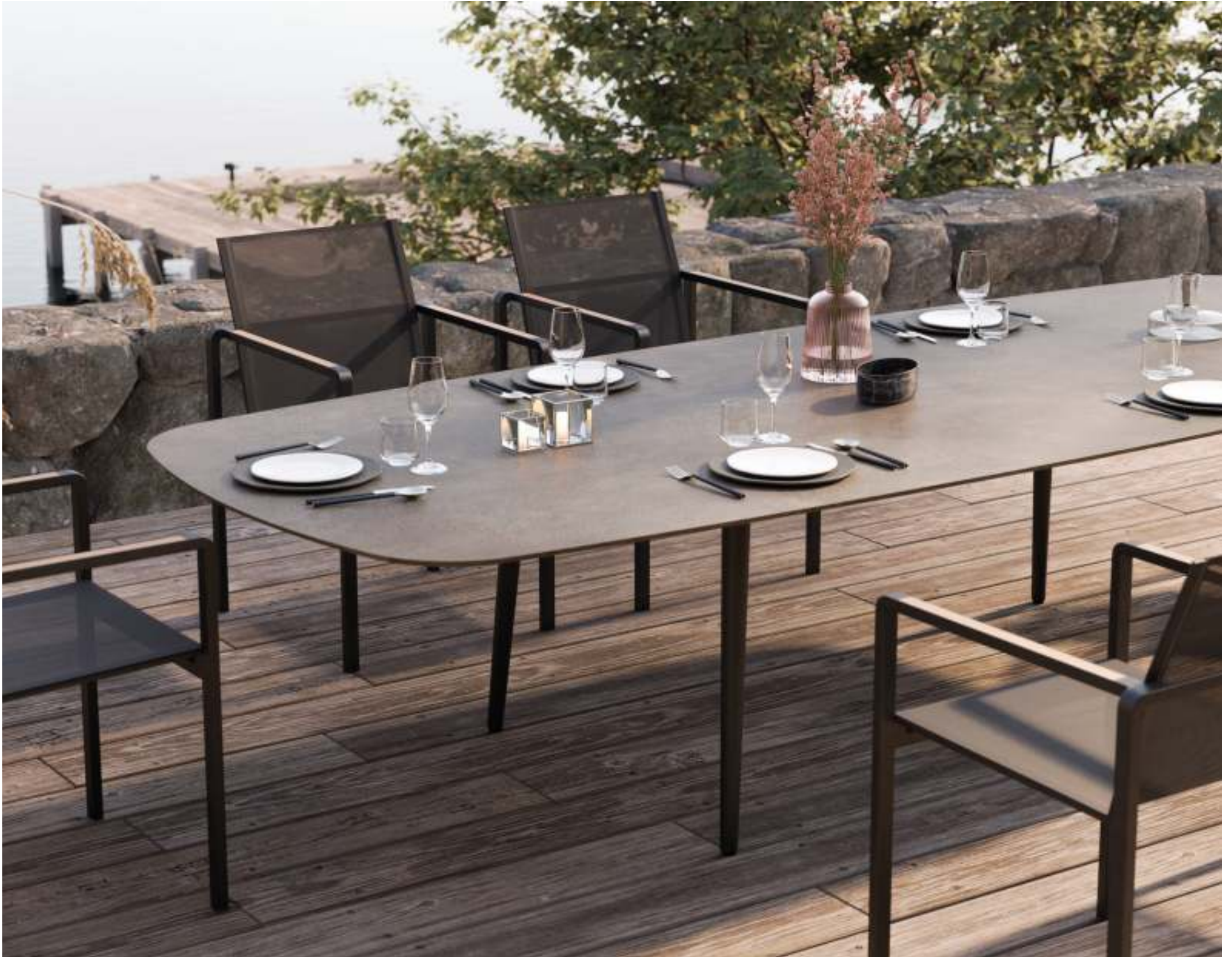
ALURA 55 DINING CHAIR (P. 195) - STYLETTO 300 DINING TABLE (P. 327)