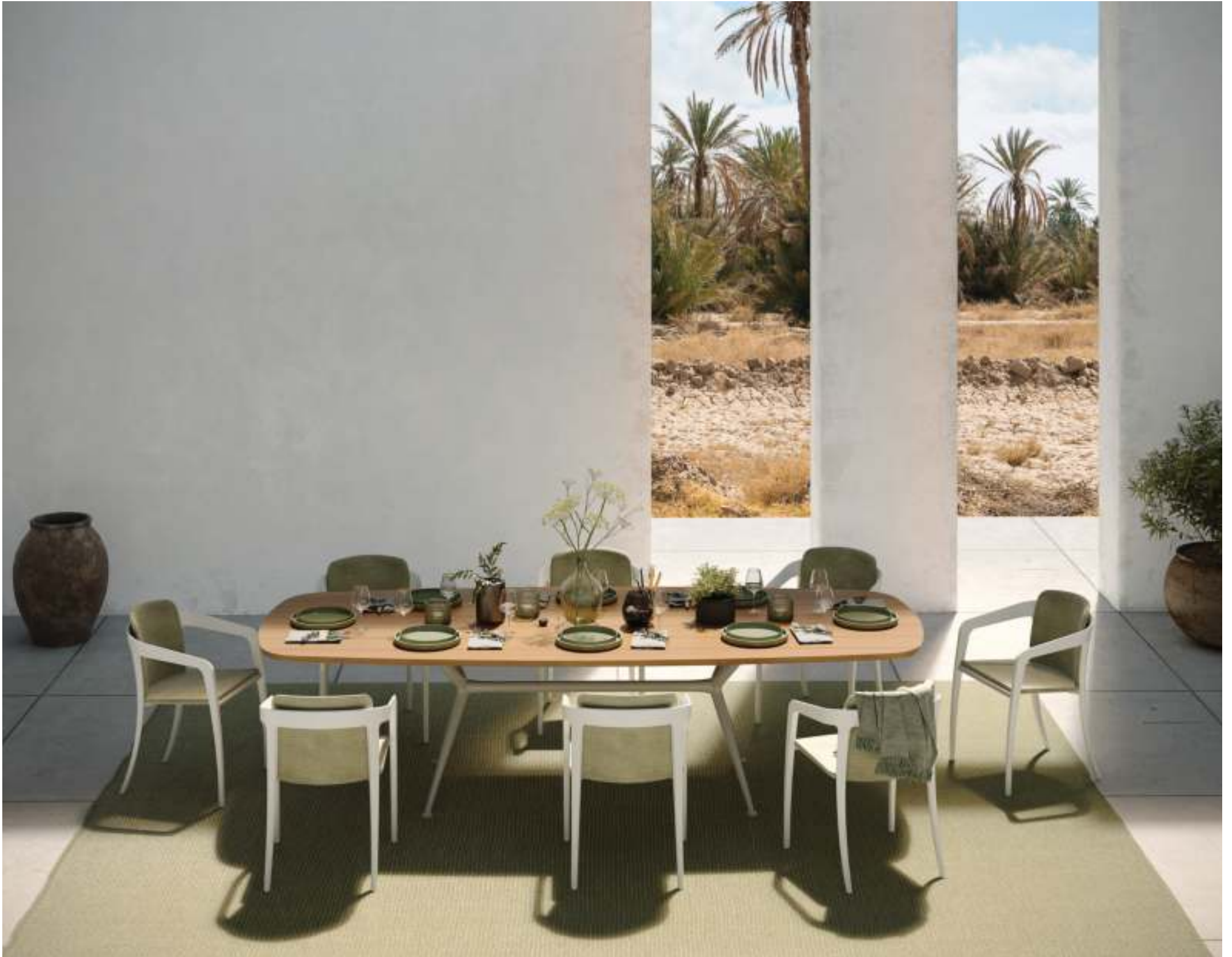
EXES 300 DINING TABLE (P. 251) - JIVE 55 DINING CHAIRS (P. 258) - RUG (P. 385)