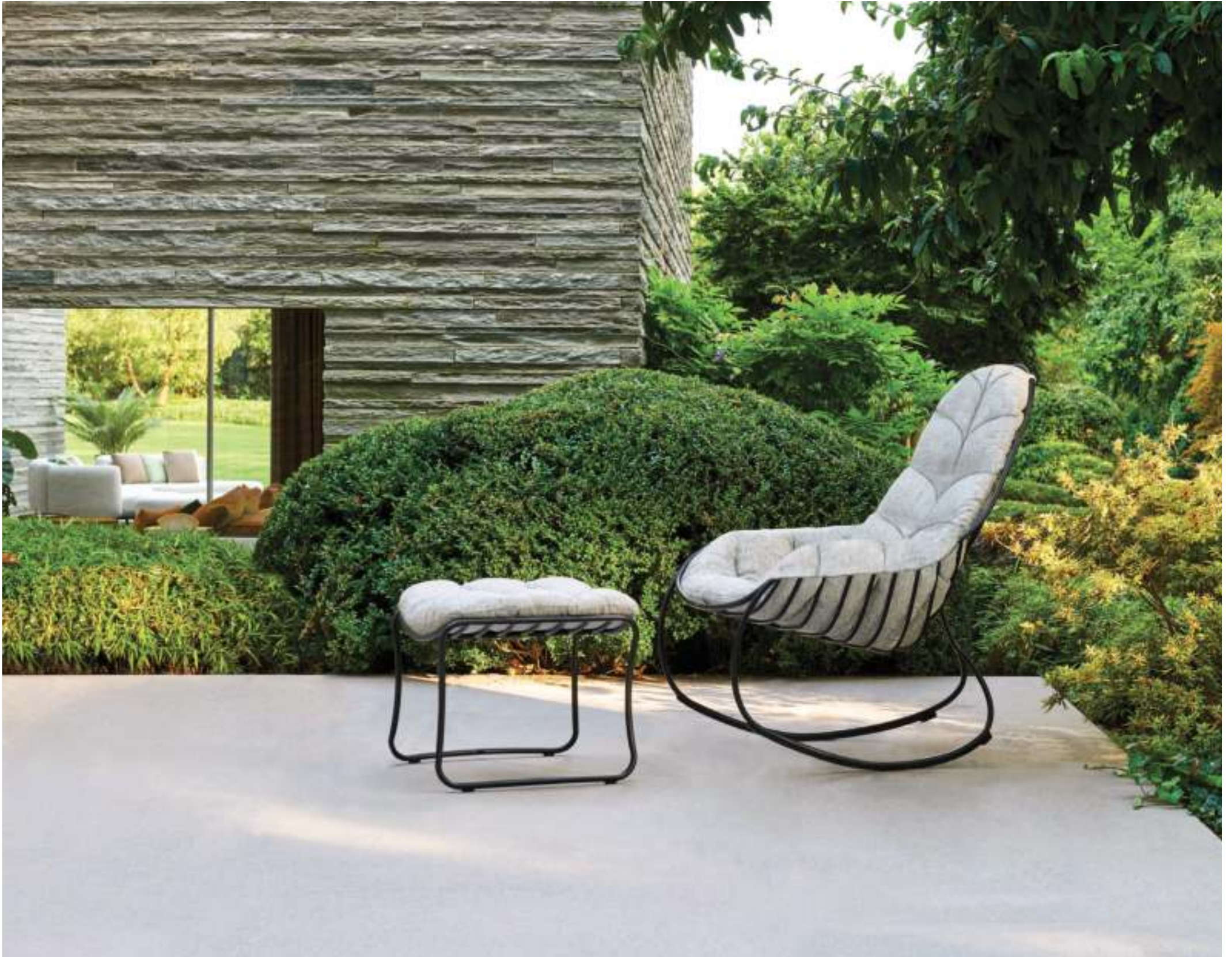
FOLIA ROCKING CHAIR & FOOTREST (P. 256)