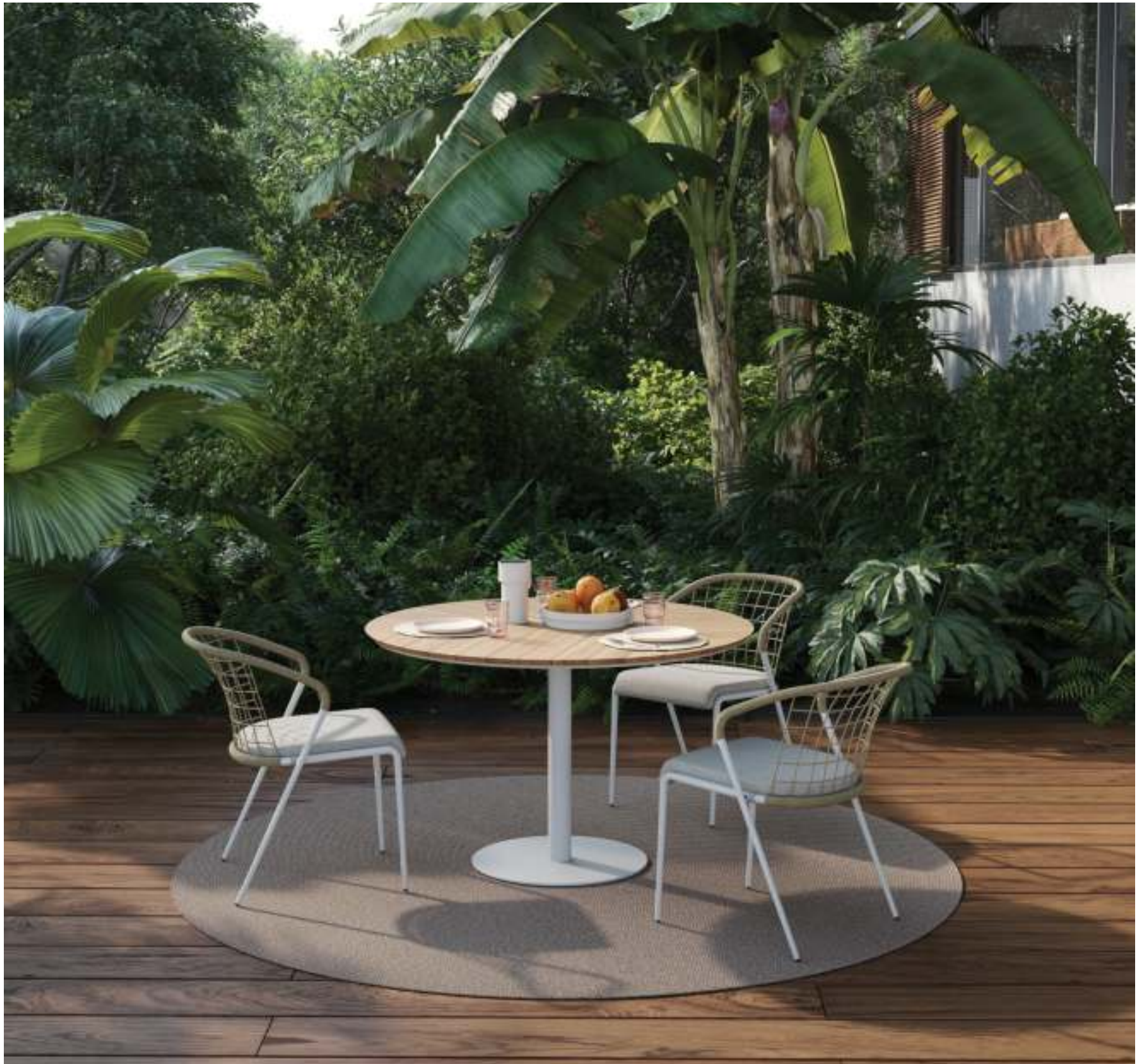
FENSI 55 DINING CHAIR (P. 254) - BUTLER 90 DINING TABLE (P. 224) - RUG (P. 385)