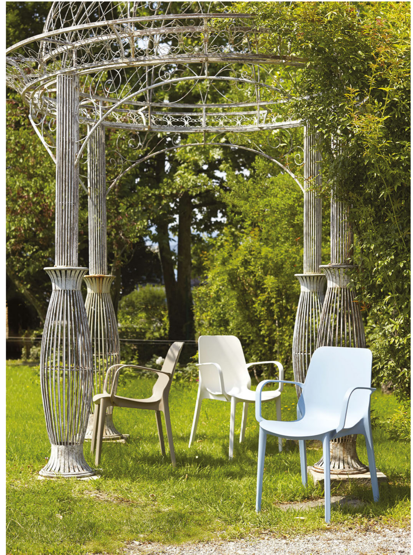
Stackable armchair Poltrona impilabile Ginevra, art. 2333

Also available in Go Green version. Disponibile anche in versione Go Green.