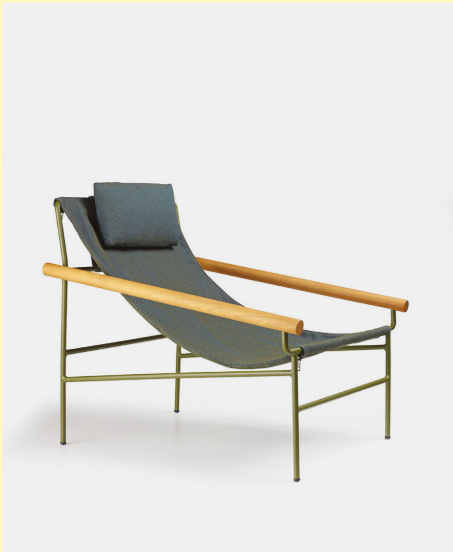
Lounge armchair Poltrona Dress_Code Smart, art. 2581

(En) The new headrest cushions fix directly to the frame of the armchair and are made with the same coordinated fabrics of the chair's padding. (It) I nuovi cuscini poggiatesta si fissano direttamente al telaio della poltrona e sono realizzati nei tessuti coordinati ai rivestimenti delle lounge.