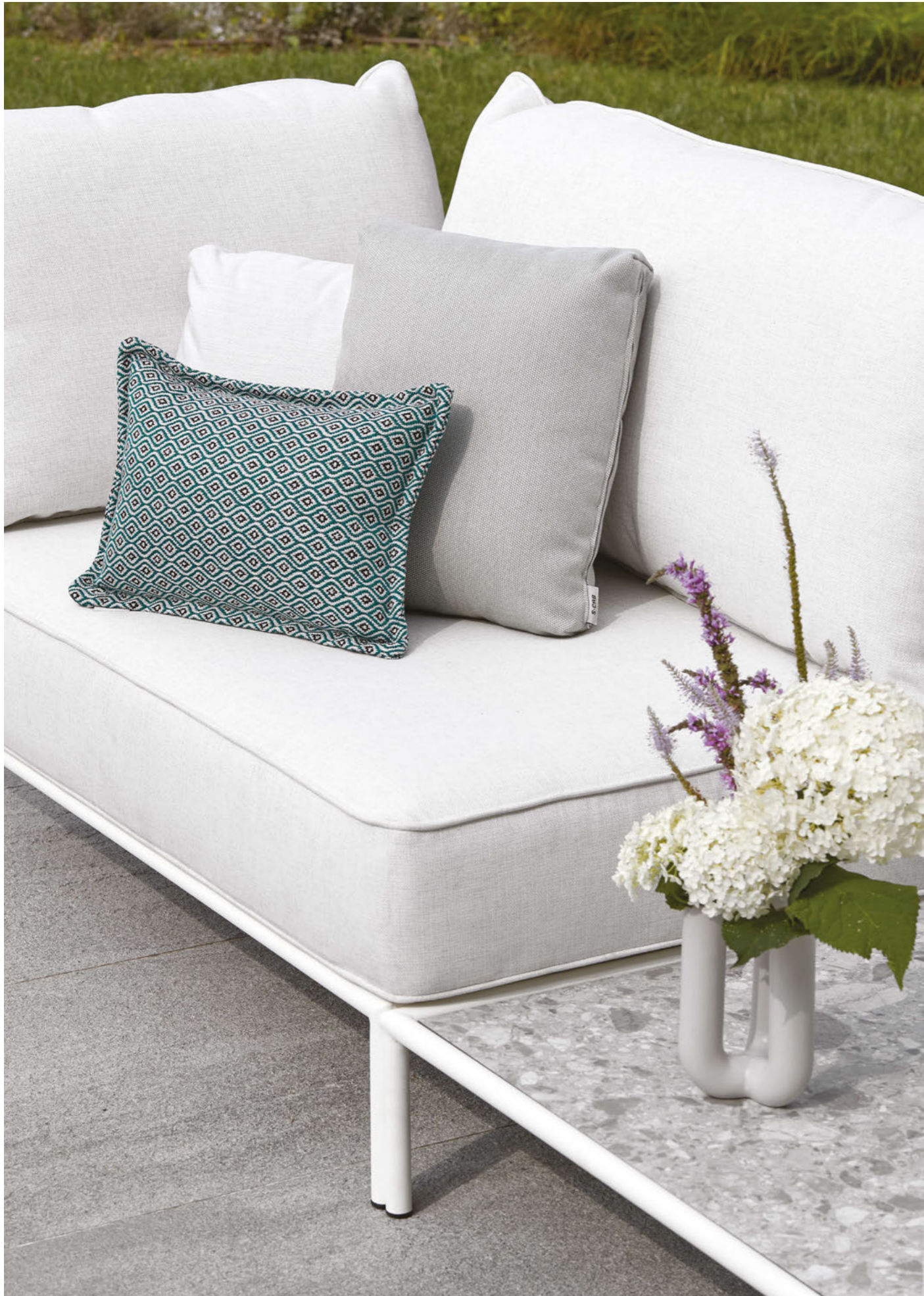
Occasional table Tavolino Flap, art. 2718 Modular system Sistema modulare Flap, art. 2887