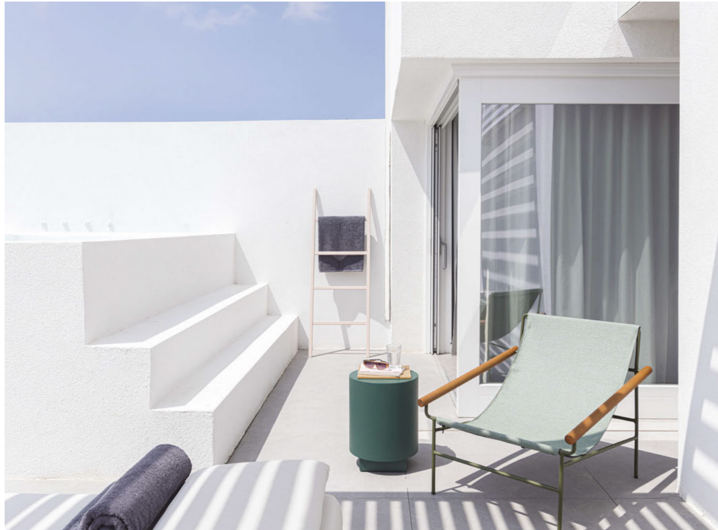
Lounge armchair Poltrona Dress_Code Smart, art. 2581