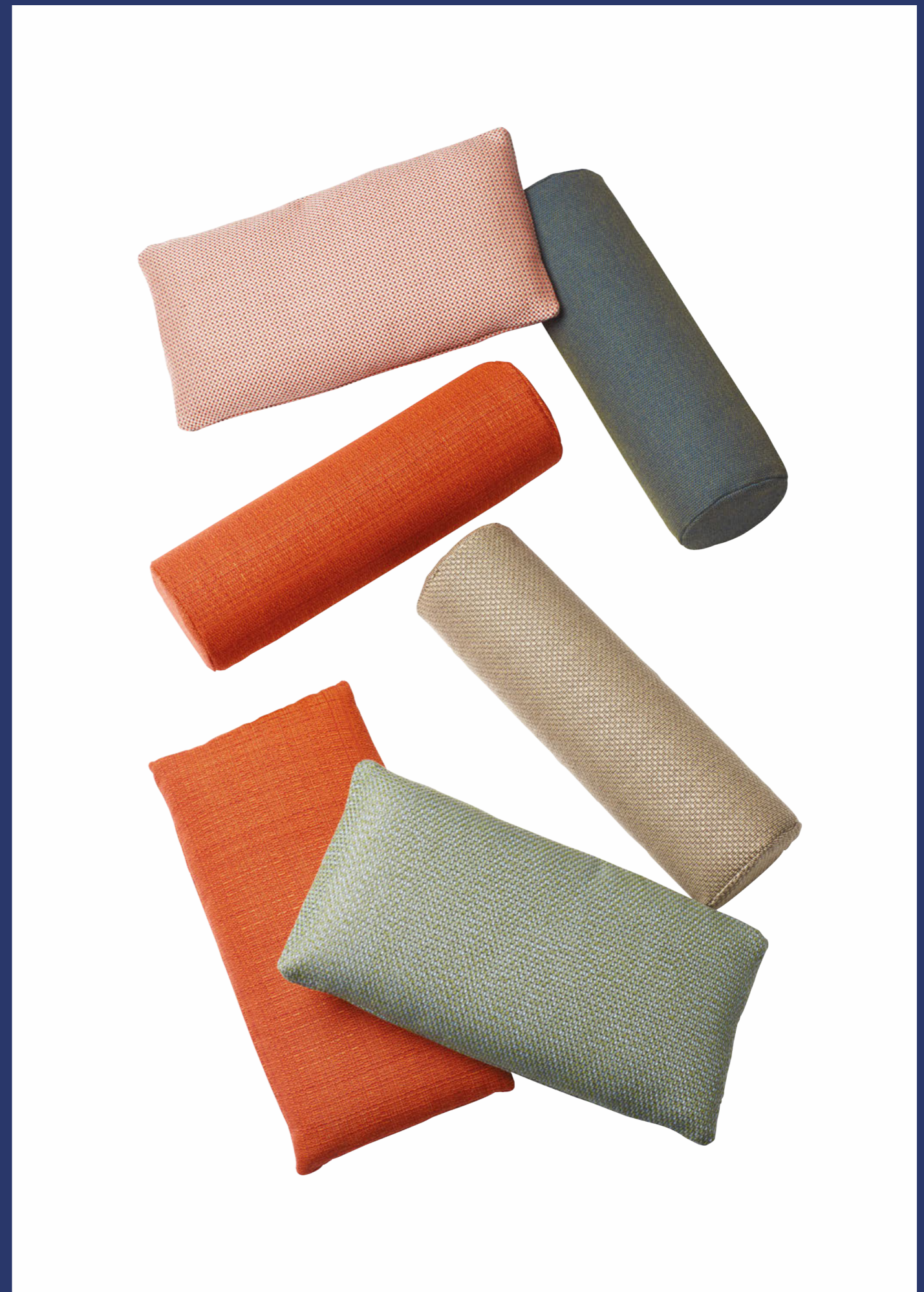
Headrest cushions Cuscini poggiatesta Dress_Code, art. 1560, art. 1561