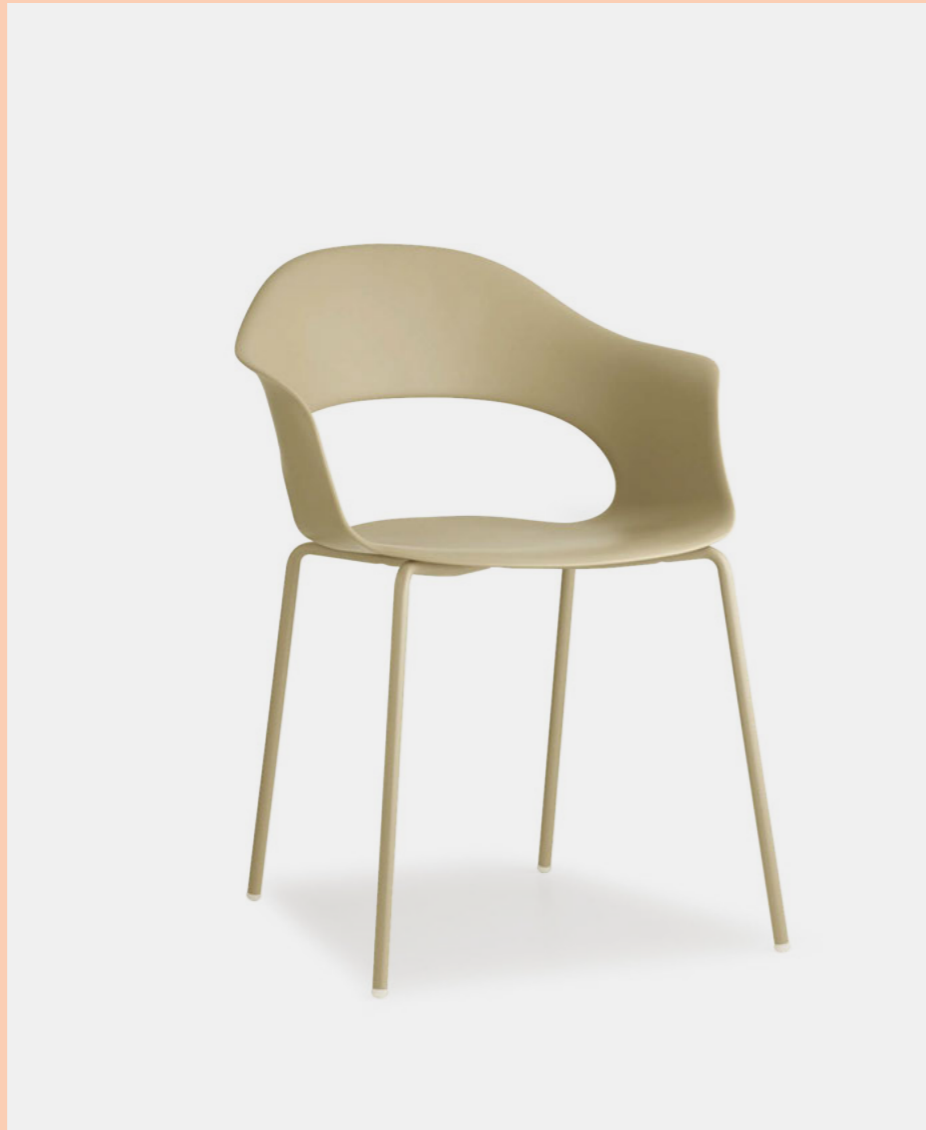
Armchair Poltrona Lady B, art. 2696

Technopolymer seat. Scocca in tecnopolimero.