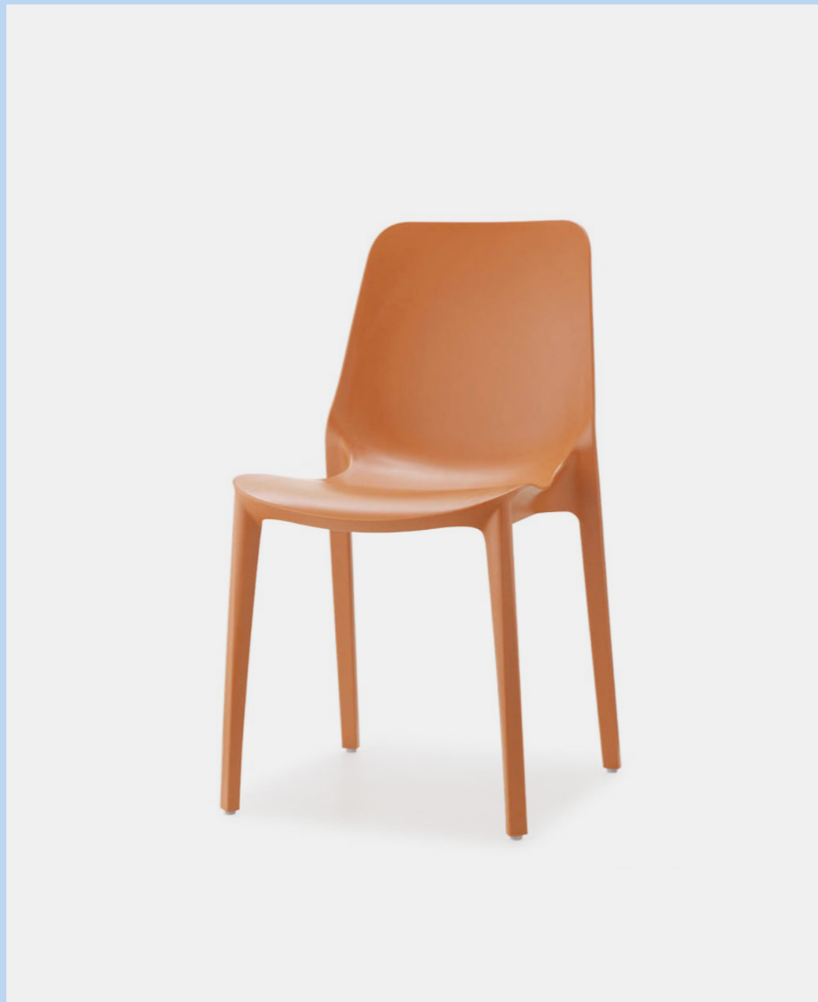
Stackable chair Sedia impilabile Ginevra, art. 2334

Also available in Go Green version. Disponibile anche in versione Go Green.